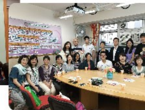
研討會海外參加者與計劃團隊及院舍同工交流